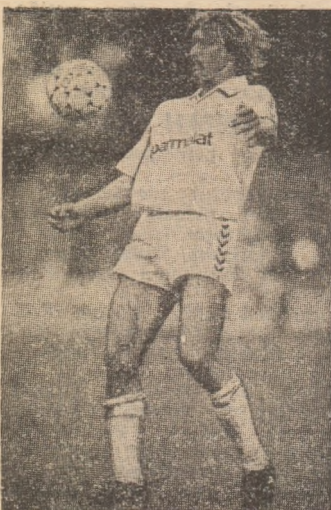
Purtătorul tricoului cu nr. 8 de la Real Madrid, vest-germanul Bernd Schuster