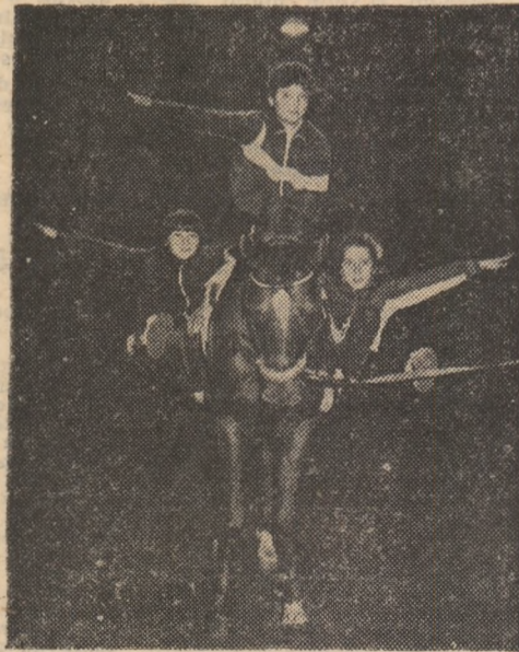
Un dificil exercitiu de echilibru executat de tinerii voltijori steliști

punsul în aplauzele generoase ale spectatorilor mici și mari care umplu tribunele a-renei seară de seară. Și dacă am apelat la această „imagine” atît de familiară nouă, tuturor, este pentru a se înțelege mai bine ce înseamnă voltije, adică un ansamblu de exerciții executate pe un cal în mișcare sau oprit. Numai că, din acest moment, pășim pe terenul ferm al adevăratei performanțe sportive, cu ale sale reguli și regulamente precise, ca rezultate și campioni, pentru că — doar pentru cine nu știe! — voltijele constituie de multă vreme una din disciplinele de bază ale echitației, alături de obstacole, dresaj sau concurs complet, avînd campionii săi europeni și mondiali. Dar, înainte de toate, pentru cei care pășesc pentru prima oară în această „lume a celor care nu evită” — caii, voltijele pot reprezenta cea dintîi treaptă spre marile suc-