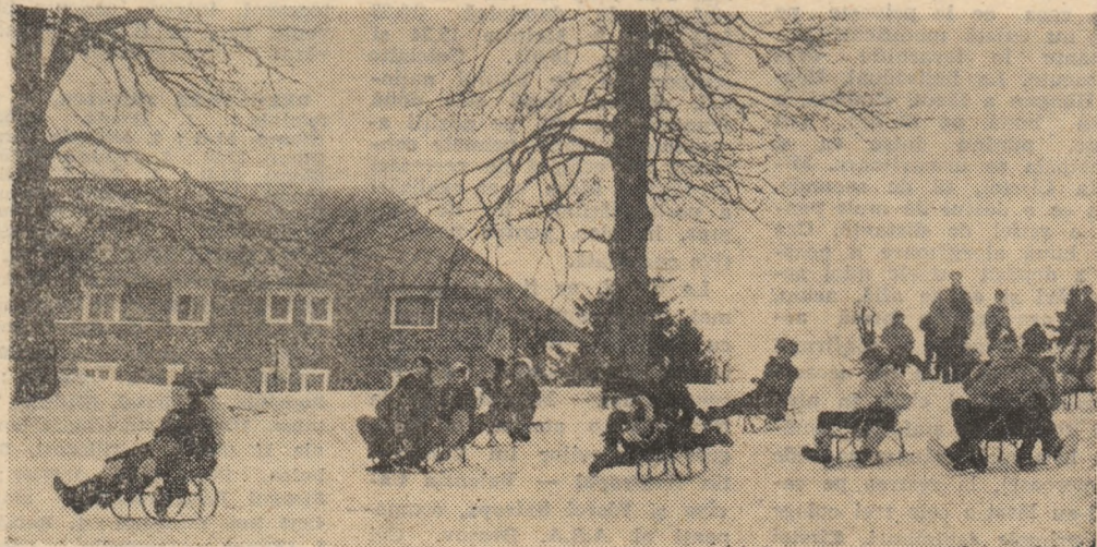
Pirliile Semenicului continuă să fie acoperite de un strat gros de nea. Prilej pentru copiii reșițeni de a participa la numeroase întreceri de sîniuș în cadrul „Daciadei”