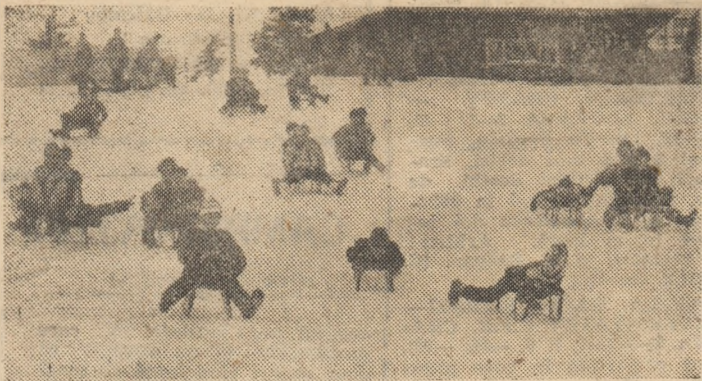
În timp ce performerii schiului sau ai biatlonului își dispută înfocată în competiții din cadrul „Daciaadei” sau internaționale, copiii, la rîndul lor, se bucură de abundența zăpezii din zonele montane încercînd... viteza săniușelor, așa cum o demonstrează și această imagine surprinsă prompt de „ochiul” aparatului de fotografiat.