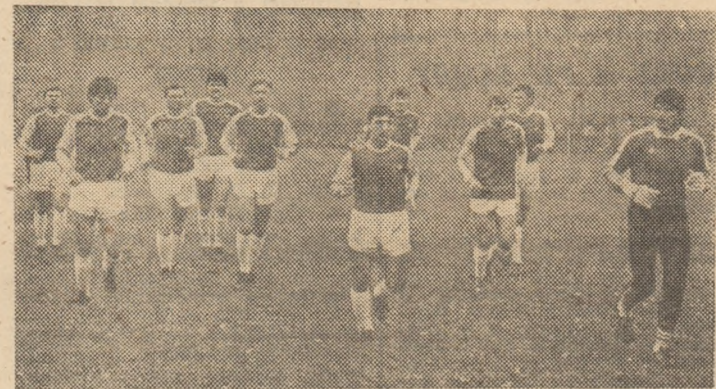
Piteștenii — în timpul „incălzirii” dinaintea uneia dintre partidele de verificare ale sezonului