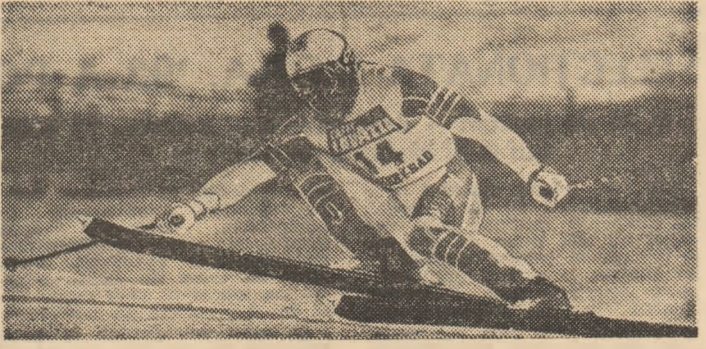
Marc Girardelli a probat, cu titlul mondial la combinată, că este cel mai polyvalent schior al momentului

Dorind, cu tot dinadinsul parcă, să demonstreze că nimic nu e scris dinainte în marea performanță, Campionatele Mondiale de schi alpin de la Vail, cu jost pline de surprize! Unele plăcuțe, altele mai puțin, dar oricum, toate determinînd comentarii dintre cele mai contradictorii și, de ce să n-o spunem, mai înresante. Mai nimic nu s-a petrecut așa cum toată lu-