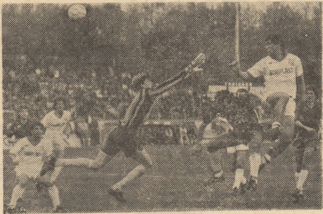
Dinamo — F.C.M. Brașov 3-0... și la acest scor, Cămătaru va trimite în bară.

fi școlarizați la Liceul industrial nr. 2 din iînd gratuit de cazare și masă.