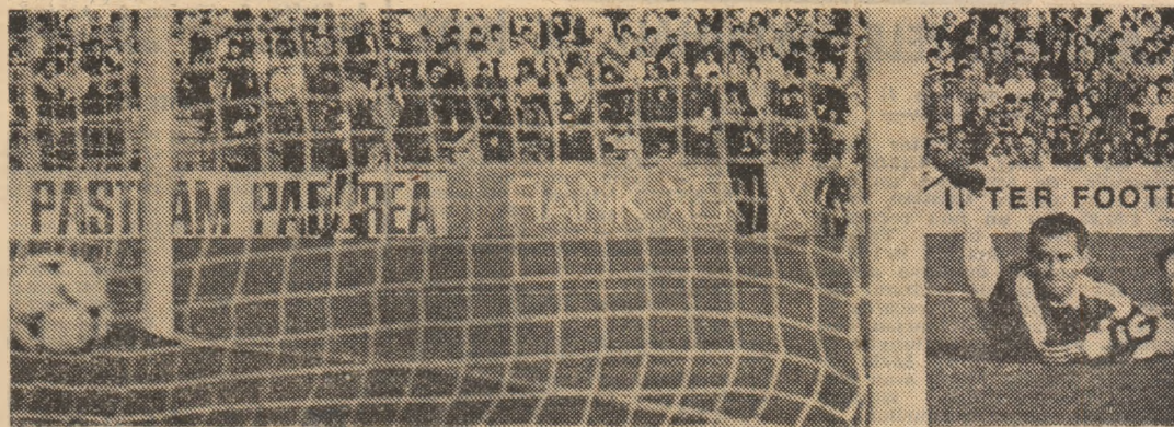
Hagi (care nu se vede în fotografie) a șutat fără speranță pentru portarul Boldici și Steaua conduce cu 2-0.

● Dinamo, victorie la scor la Tg. Mureș ● F.C. Inter Sibiu, punct prețios la Oradea, în lupta pentru un loc „european“ ● Întrecere acerbă în „două treimi“ ale clasamentului: între locurile 6 și 17, cinci puncte diferență!