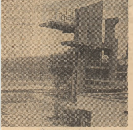
lui e gata să-și primească oaspeții...