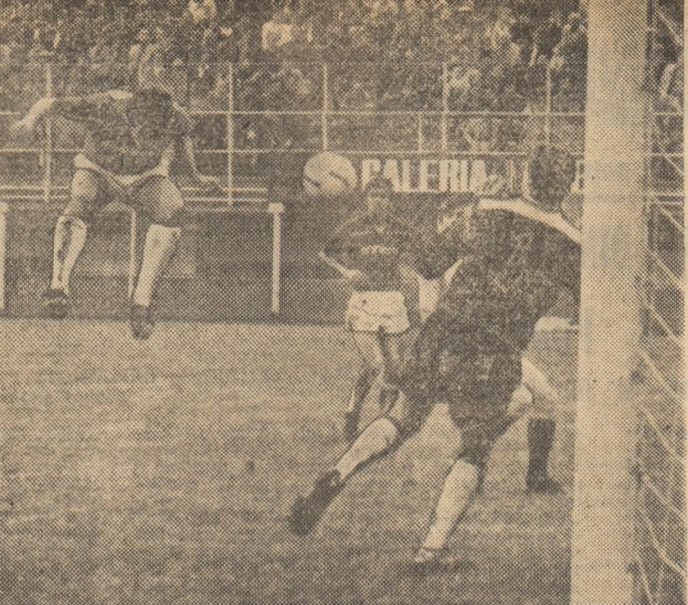
Minutul 86 al partidei Rapid - Oțelul 3-0: Pomohaci reia plasat, cu capul, înscriind al treilea gol al giuleștenilor.