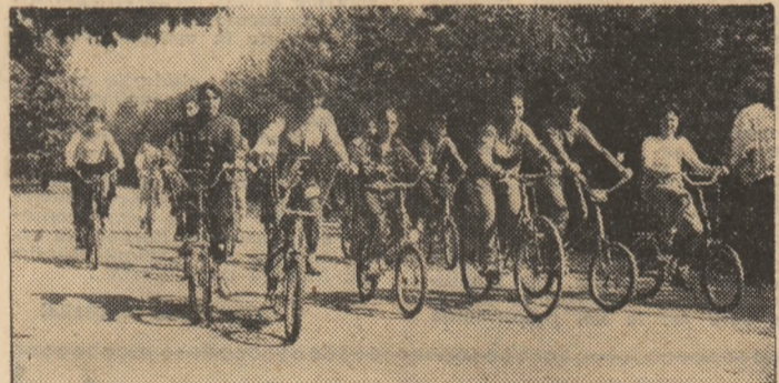
Semi-fond, feminin, de ciclism pe alei

După cîteva zile în care a ploiat din belșug, fiind vreme închisă, ieri a apărut din nou, generos, soarele, luminînd micile dar concludentele manifestări inițiate și desfășurate sub genericul marii competiții naționale. „Deschiderea” Daciadei în sectorul 3 a avut loc în Parcul Voinicelul, cea din sectorul 5 — la Stadionul Progresul, din sectorul 2 — în Parcul Morarilor și la Stadionul F.R.B., iar Sectorul A-