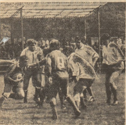
mo si al nationalei, Gh. Ion, intr-o ameciul de sambata, cu Griuifa Roșie