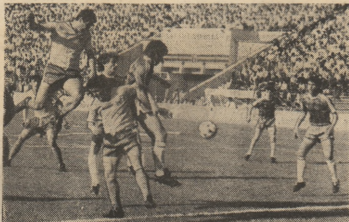
Cămătaru a apărut — prompt — în mai multe situații de gol; nu a apărut însă... și golul pornit din șutul lui

Din punctul nostru de vedere socotim că chiar prima confruntare cu fotbalistii din nord poate fi transantă pentru echipa României, dacă va evo-