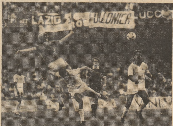
Nou Camp... Stoica continuă să lupte, dar... olandezii Van Basten — Rijkaard sînt și de această dată în superioritate numerică.

● Așa după cum am mai anunțat, urmărind în permanență PROGRAMUL LOTO-PRONOSPRT și rubrica de față puteți afla date interesante în legătură cu concursurile PRONOSPRT se vor programa partide din CUPA INTERNAȚIONALĂ DE FOTBAL-INTERTOTO 1989!