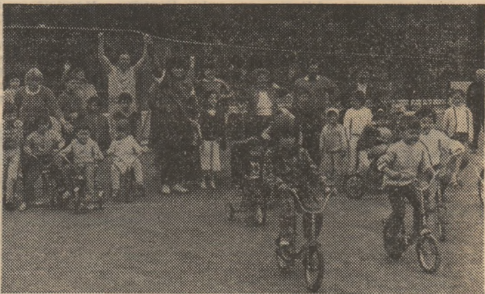
Explozia de bucurie de pe stadionul Voința din Capitală marchează startul „furtunos“ în cursa bi și tricicletelor.