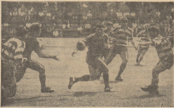
Atac al campionilor, Oroian pasindu-i lui Iosef. (Fază din meciul Steaua — Farul 33—12)

simplic, ele reușind însă procentajul maxim în intervalul de referință, ceea ce coroborat cu restul rezultatelor înregistrate, le-a permis desprinderea în fruntea clasamentului — cu 48, respectiv 47 de puncte, campioana având un meci mai puțin — față de cele 43 p ale băimărenilor. Disputa pentru titlu rămâne interesantă, cu mențiunea că lidera păstrează principala șansă. La celălalt „pol” lucrurile par clare în bună măsură, pentru T.C. Ind. Constanța și Politehnica Iași existind acum doar teoretic posibilitatea de a evita coborirea în a doua grupă valorică.