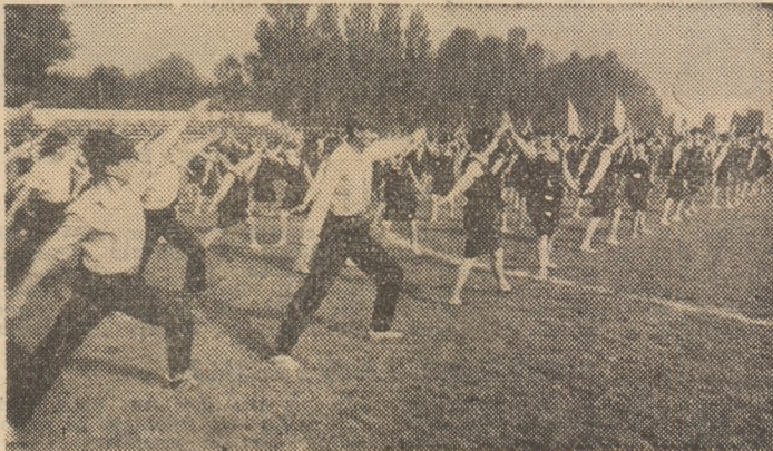
O secvență din „Festivalul primăverii“