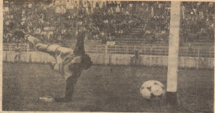
Portarul Prunea mai scapă o dată cu fața curată și... Sportul Studențesc - Universitatea Cluj-Napoca 0-0