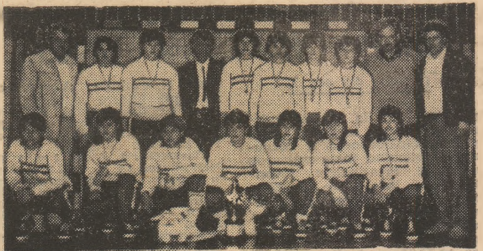
Chimistul Rîmnicu Vilcea, după festivitatea de premiere

În prima manșă a turneului final al Diviziei A de popice