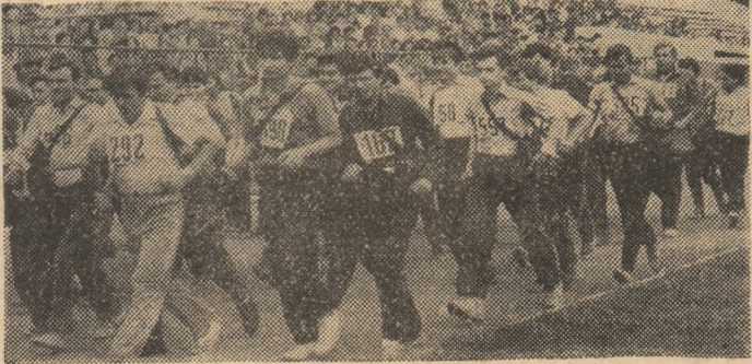
La câteva momente după startul în proba masculină

PENTRU A ADUCE VEȘTILE CU UN CEAS MAI DEVREME..