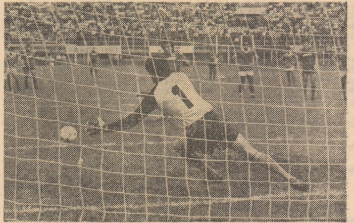
Prin acest penalty transformat de Rada, Rapid a deschis scorul în partida de ieri cu Gloria Buzău