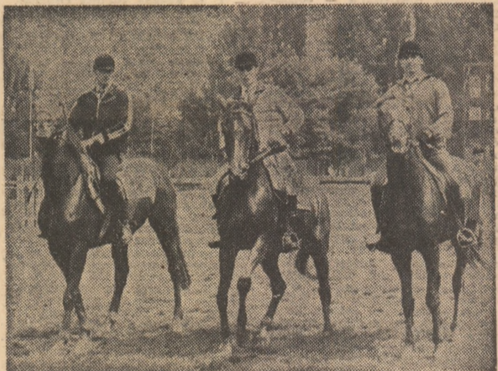
La încheierea concursului, echipa României, învingătoare în concursul de ștafetă.

Plăcută surpriză oferită de juniori în proba de cros