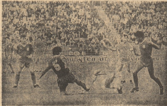
Mezinul echipei craiovene, Papa, blocat în ultima clipă de fundașul Dicu.

gresivă, în sensul bun al cuvî- ntului (Văduva și Cotea), o apă- rare care a închis bine culoa- rele, care a scos câteva ba- loane grele, care a avansat grupat spre linia de centru. Universitatea a prezentat în finală o echipă bine pregătită sub toate aspectele (o mină de ajutor i-a dat lui Aurică Bel- deanu și antrenorul Nicolae Zamfir), care a impresionat a- sistența, și asistența a aplau- dat-o la scenă deschisă. Dar nu putem încheia fără a subli- na încă două aspecte: contribu- ția învinsei, Steaua menți-