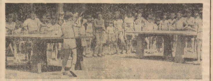
În tabăra de la Snagov, mesele de tenis sînt amplasate anume, spre a savura și răcoarea pădurii