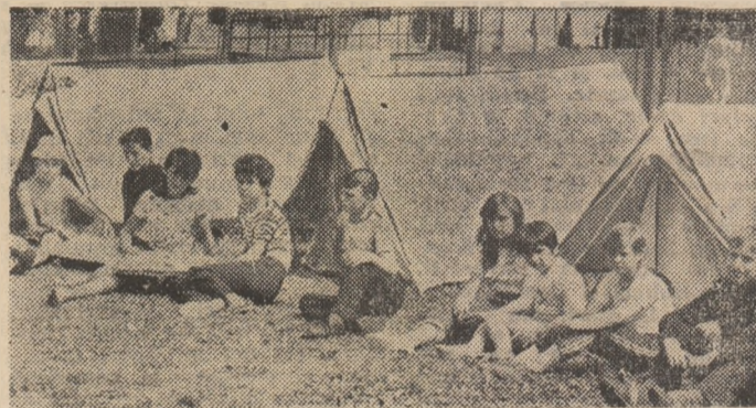
Vacanța școlară, cu zile de neuitat în tabăra de la Snagov

Inspectoratul școlar al Sectorului 4. Și, după molipsitoarea veselie a copiilor, după pofta de joacă și sport, se cheamă că e organizată la înălțime, comandamentul taberii funcționând non-stop. O zi de vacanță aici la Snagov înseamnă o mie și una de acțiuni îndemnoape