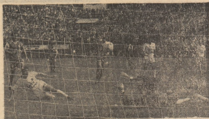
Mingea respinsă de portarul Stancev la penaltyul din min. 17 va fi trimisă de această dată în plasă de către Goanță.