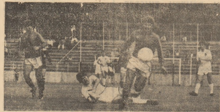
Pistol în acțiune spre poarta studenților bucureșteni. Secvență din partida susținută de echipa F.C. Olt, în returul campionatului, pe stadionul din Regie.

tră face parte din grupa a 13-a, alături de formațiile Norvegiei și Scoției. Pînă la 10 septembrie urmează să se stabilească — de comun acord — datele de disputare ale meciurilor, ziua limită fiind 8 aprilie 1990. În cazul în care reprezentativa României va obține dreptul de participare la turneul final, ea va fi repartizată în grupa C, împreună cu cîștigătoarele grupelor a 4-a, a 6-a și a 11-a. Iată și componența celorlalte serii preliminare : Islanda și Suedia (1), Finlanda și Danemarca (2), Țara Galilor și Irlanda de Nord (3), R.F. Germană și Luxemburg (4), Spania și Liechtenstein (5), Cehoslovacia și Malta (6), Turcia și Austria (7), Cipru și Grecia (8), Polonia, Olanda și Italia (9), Bulgaria și Ungaria (10), Franța și Elveția (11), San Marino și Portugalia (12), Belgia și Irlanda (14), Iugoslavia și U.R.S.S. (15).