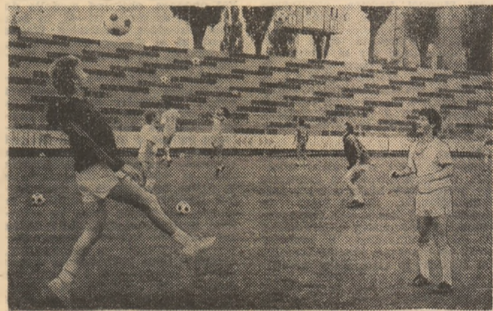
Secvență dintr-un antrenament al fotbalistilor constănțeni

Constantin. La acest capitol nu avem vreo nemulțumire. Important este să realizăm completarea lotului cu câteva elemente de valoare, alături de cele de perspectivă, pe care le-am remarcat în formații din categorii inferioare. Fotbalul de astăzi cere jucători compleți în linia de mijloc, definită ca vitală în funcționarea unei echipe. Pentru că aici evoluează interii de ieri, jucătorii care au și res-