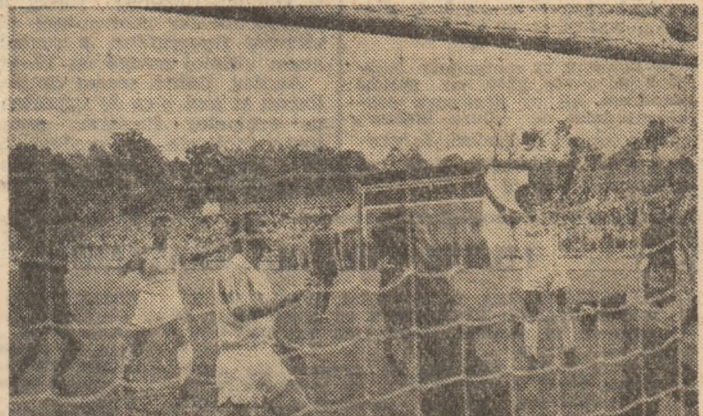
Toți jucătorii privesc spre balonul catapuitat în plasă de Culcar. Așa s-a deschis scorul, ieri, pe stadionul Victoria.