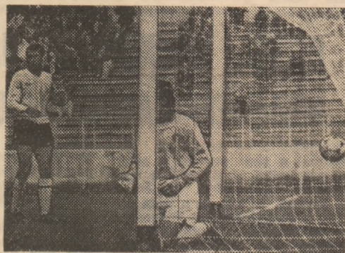
Faza unicului gol din meciul Sportul Studențesc — Universitatea Cluj-Napoca