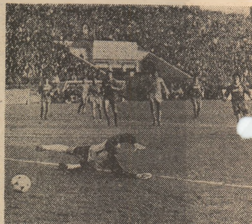
Minea a șutat din interiorul careului și „Nitu” scoată pentru a treia oară mingea din... Foto

La reluare, pică neașteptat și, ca urmare, ține din nou CORAȘ, care pierde, pe subțuții de go