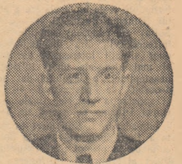
Iurii Averbach campion de șah al U.R.S.S. pe anul 1953