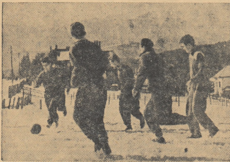
Jucătorii echipei Flacăra Ploești au angajat o „miuță” pe terenul amenajat la Predeal.