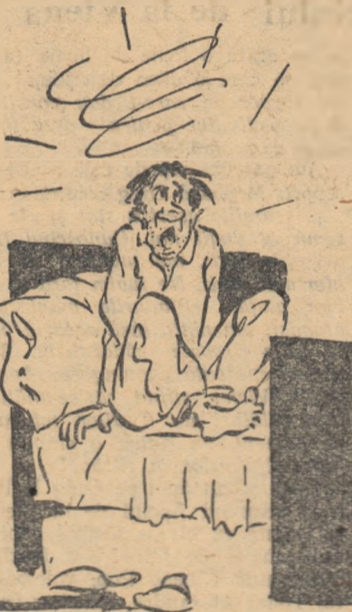
Groznic coșmar, domnule!... Se făcea că activam!..