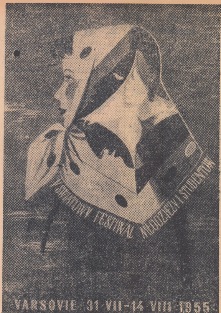
Unul din așizele celui de al V-lea Festival Mondial al Tineretului și Studenților pentru Pace și Prietenie. Autorul așizului este graficiana poloneză Olga Siemaszkowa.

Șefii guvernelor celor patru puteri au declarat în unanimitate că sînt pe deplin convinși că munca miniștrilor de externe nu numai că nu va avea o importanță mai mică decît actuala conferință de la Geneva, ci va fi poate chiar mai importantă în ce privește slăbirea încordării în relațiile internaționale și înțelegerea între state.