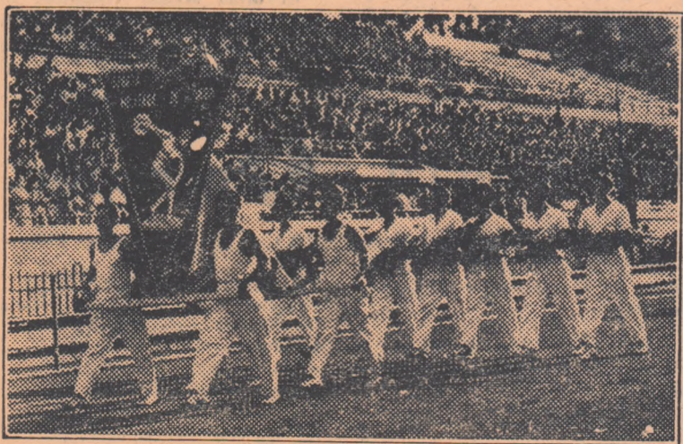
Aspect de la defilarea sportivilor din cadrul festivității de deschidere a Spartachiadei militare de vară, care a avut loc pe stadionul Republicii.

Bobet a câștigat pentru a treia oară consecutiv această competiție ciclistă. Locurile următoare au fost ocupate de Brankart (Belgia) la 4'53", Gaul (Luxemburg) la 11'30", Fornara (Italia) la 12'44", Rolland (Franța) 13'18". Din cei 130 de cicliști care au luat startul în prima etapă numai 70 au sosit la Paris, restul abandonînd sau fiind eliminați din cursă. Louison Bobet, câștigătorul întrecerii, a parcurs 4.450 de km. în 130h 29'26",