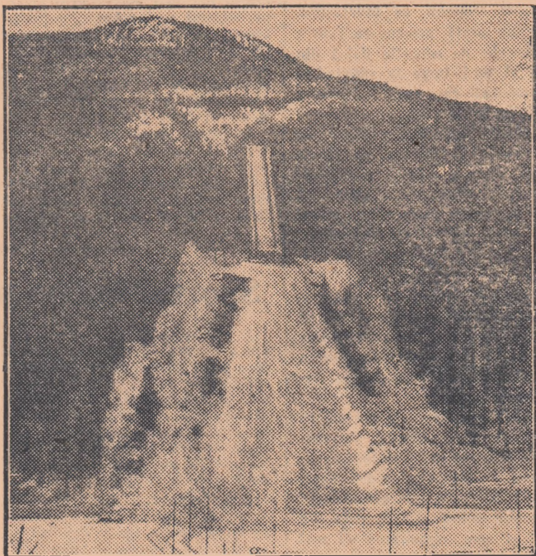
Trambulina „Italia” pe care se vor desfășura probele de sărituri din cadrul Olimpiadei de Iarnă