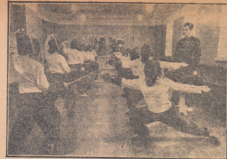
...Aici se ridică elementele tinere. În secția de scrimă a asociației Dinamo se pregătesc viitorii campioni

Rudolf Szwand, portarul echipei naționale și jucător în echipa Wiener Sport Klub, a fost exclus pe viață din echipa națională a