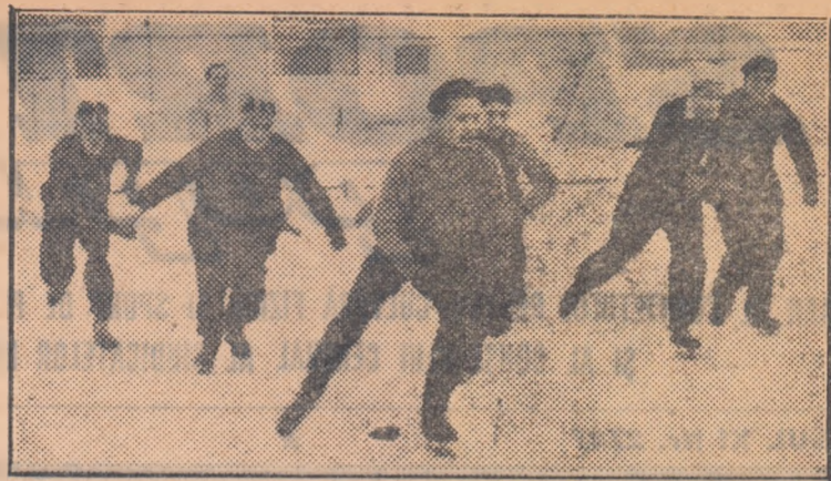
S-a dat startul în proba de patinaj viteză. Aspect de la un concurs popular de patinaj organizat anul trecut în Capitală