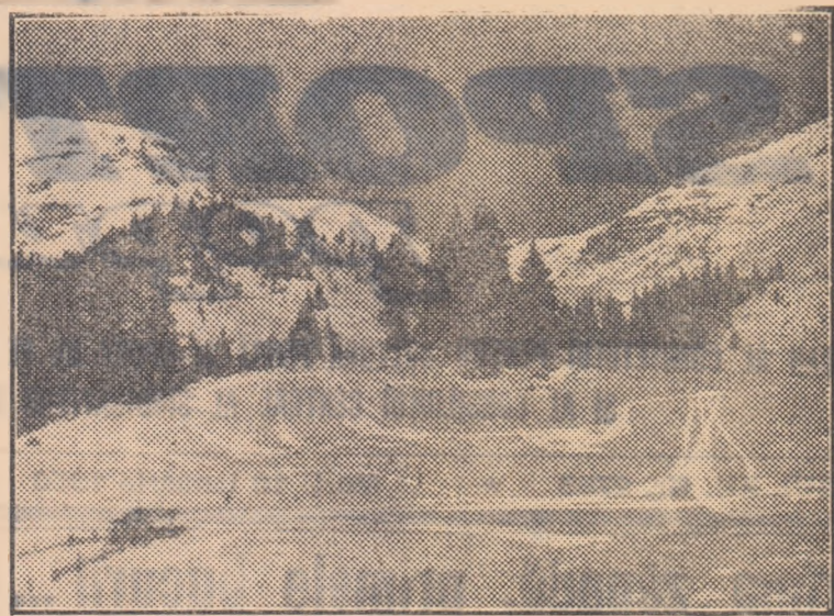
În aerul curat al munților, elevii din Capitală au petrecut o vacanță de ne uitat