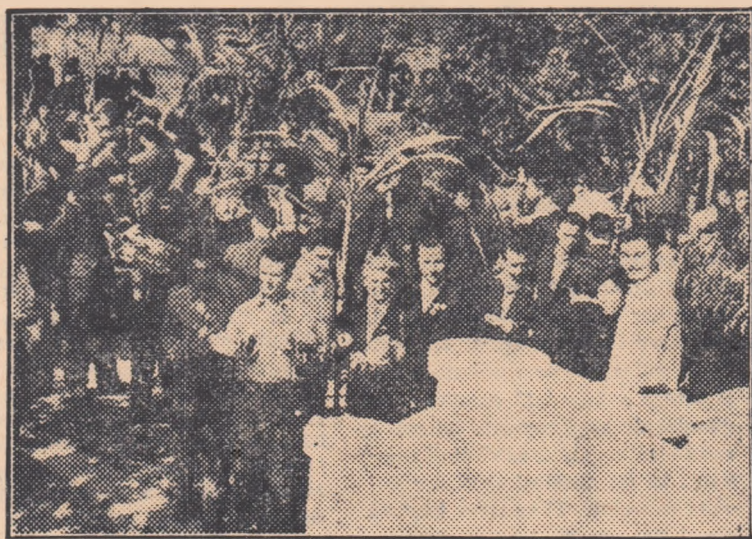
Delegația noastră, însoțită de un grup de sportivi chinezi, vizitează unul din mînunatele parcuri din Canton

București — Kiev — Moscova — Sverdlovsk — Novosibirsk — Irkutsk — Pekin: 26 ore și 15 minute de zbor efectiv cu avionul. Ogoare desmîrșite, delta și gurile Dunării, feeria de lumini a Moscovei, imensa Siberie, Baicalul străjuit de munți acoperiți cu zăpadă, podișul Gobi, lipsit aproape complet de vegetație, zidul chinezesc și, în cele din urmă, orezăriile în formă de terase ce urcă întocmai unor trepte spre virfurile dealurilor: iată itinerarul nostru. Peisajul chinez, așa cum mi-l închipuim din cărți, începe să se desfășoare sub noi; ne simțim bătaile inimii din ce în ce mai dese și mai puternice.