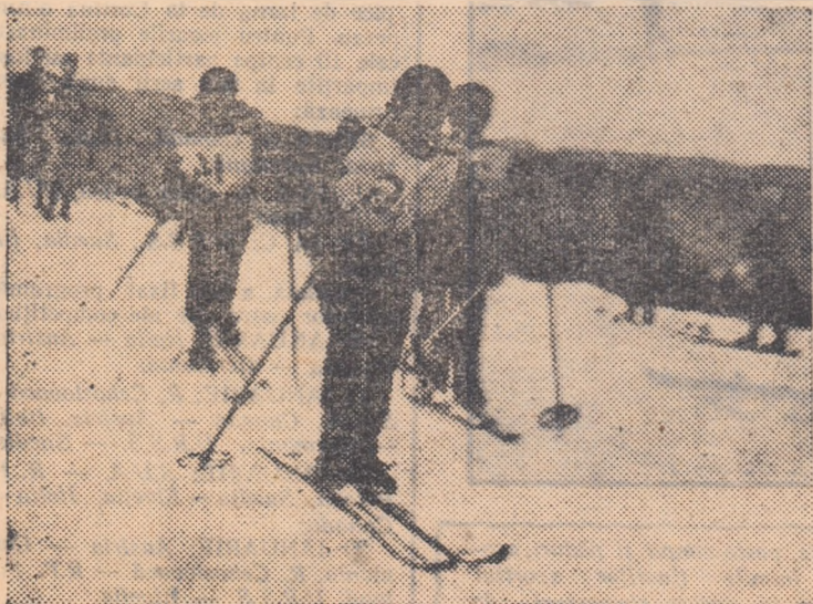
În satele în care iarna a fost mai... darnică, tinerii sportivi au și început să se avînte pe schi, în întreceri dirze