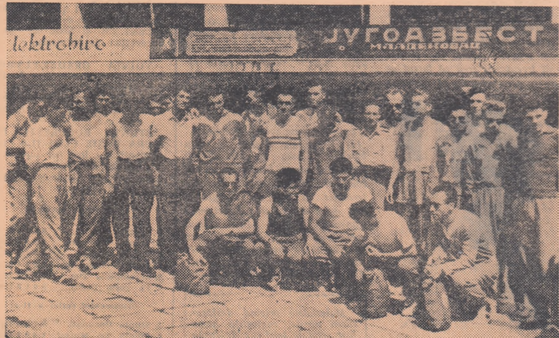
Echipa reprezentativă de atletism a țării noastre fotografiată în fața stadionului Armatei Populare din Belgrad.