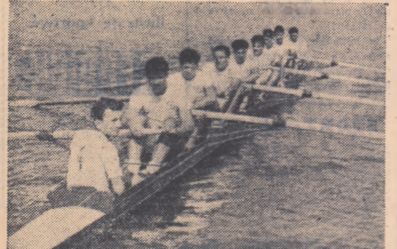
Echipa de 8+1 al asociației Dinamo a cucerit titlul de campioană a probei.