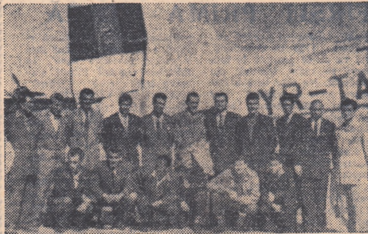
„Tradiționala fotografie de plecare! Să sperăm că și la întoarcere dinamoviștii bucureșteni vor bucura obiectivului fotografic

În formația turcă nu se vor produce multe schimbări în raport cu „unsprezecele” prezentat pe stadionul „23 August”.