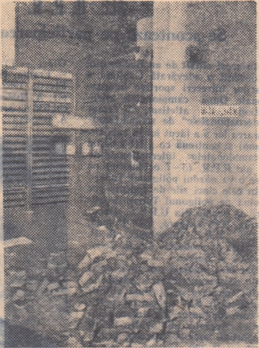
Aici au fost două... sobe de teracotă

Cu condeiul pregătit de „atac”, cu un blok-notes nou-nouț și cu... fotoreporterul nostru L. TIBOR, am luat drumul Galațiului, gândindu-mă la reportajul care — neapărat — trebuia să poarte un titlu „tare”. Cam așa ceva: „Oameni care iubesc paragina” sau „Vinovalii să fie aspru pedepsiți!...” Așa le trebuie. Să se învețe mintea!