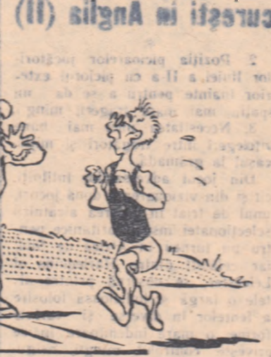
— Te faci de ris! Ceiași au terminat și la mai ai încă 5 ture! — Nu-i nimic. Vin ele probele tehnice. Să-i vedem atunci...

Și ca să nu mă limitez la critică imi permit să fac cîteva propuneri: să se organizeze pentru început competiții orașenești în genul diviziei de atletism cu probele: sprint, înălțime, greutate, suliță. Se vor întîlni cîte două echipe. La fiecare probă