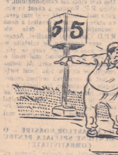
— Te faci de ris! Ceiași au terminat și la mai ai încă 5 ture! — Nu-i nimic. Vin ele probele tehnice. Să-i vedem atunci...

4. Bazele de antrenament sînt insuficiente, iar cele care există sînt neglijate și greu accesibile.