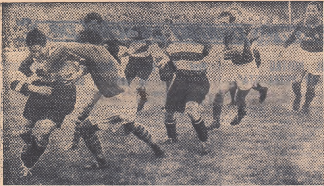
Fază pe înaintare din al doilea joc