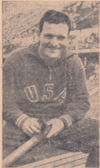
Bob Richards, de două ori campion olimpic la săritură.

În 1952, la Helsinki, după o luptă pasionantă cu compatriotul său Laz, Bob Richards a reușit să