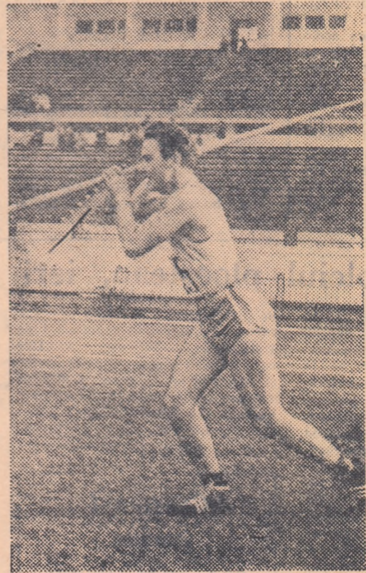
Electricianul din Oslo, Eigil Danielsen este unul dintre cei mai tineri aruncători din lume. În același timp, atletul norvegian este și cel mai bun dintre toți. Rezultatul de 85,71 m. i-a adus o triplă satisfacție: campion și recordman olimpic și recordman mondial. Iată-l pe Danielsen pregătindu-se pentru aruncare pe stadionul Republicii din București.

În cursa de 200 m. bărbați s-au desfășurat ieri seriile și sferturile de finală. Iată rezultatele înregistrate în sferturile de finală: I—1. Kaliq (Pakistan) 21,1; 2. Agostini (Trinidad) 21,1; 3. Pohl (Germania) 21,3; II—1. Stanfield (S.U.A.) 21,1; 2. Tokarev (U.R.S.S.) 21,2; 3. Conceicao (Brazilia) 21,3; III—1. Baker (S.U.A.) 21,2; 2. Mandlik (Cehoslovacia) 21,3; 3. Haas (Germania) 21,5; IV—1. Morrow (S.U.A.) 21,9; 2. Rak (Noua Zeelandă) 22,0; 3. Shenton (Anglia) 22,1.