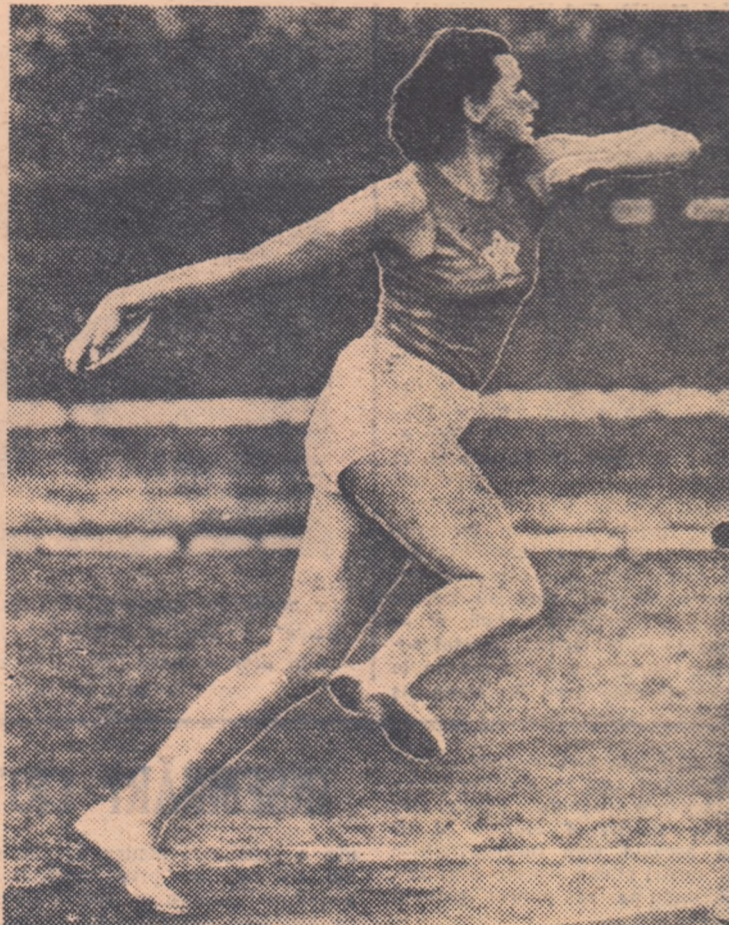
Aruncatoarea cehoslovacă Olga Fikotova, studentă la facultatea de medicină din Praga, a realizat la Melbourne un rezultat excepțional: 53,69 m. Cu această performanță ea a cîștigat titlul olimpic la disc.