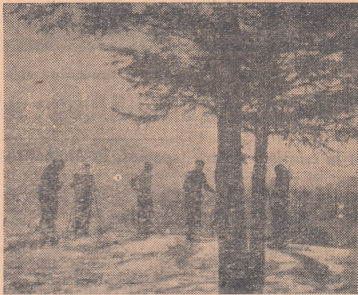
Abia s-au asternut primele straturi de zăpadă și iubitorii schiului au și ieșit pe pîrtii! Iată un grup de tineri care-și desăvîrșesc pregătirile în vederea primelor întreceri.