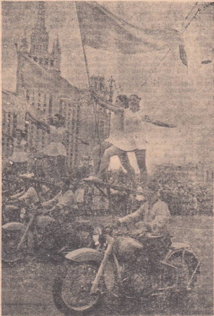
În zilele de neuitat ale Festivalului tinerii sovietici își arată măiestria executînd pe străzile Moscovei spectaculoase piramide de motociclete.

La ora cînd telefonăm, miile de delegați sînt încă pe stadion. Se