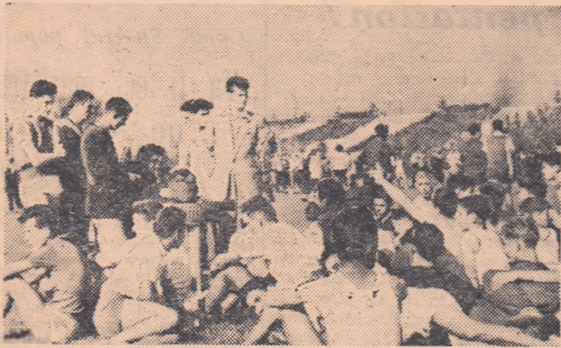
În aceste zile pe terenurile de sport din Capitală vin sute de elevi și eleve care participă la diferite întreceri organizate în cadrul Lunii Prieteniei Romîno-Sovietice.

Printre angajamentele luate de harnicii muncitori textiliști de la fabrica „Dacia“ din Cisnădie, ne scrie corespondentul nostru C. Crețu, multe sînt în legătură cu sportul. Astfel, angajamentele privind rezolvarea problemei terenurilor de volei din apropierea clubului, organizarea unui turneu de fotbal între reprezentativele celor cinci întreprinderi textile din localitate ca și desfășurarea întrecerilor pe colectiv la tenis de masă, șah, volei, popice și ciclism au devenit fapte.