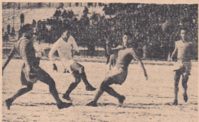
Fotografia pe care o vedeți mai sus a fost făcută în a doua parte a jocului, în momentele cînd selecționata primei serii (tricolori de culoare închisă), a reușit să egaleze. După cum se vede, atacurile acestora, supranumerice uneori, au pus la grea încercare apărarea selecționatei seriei a doua