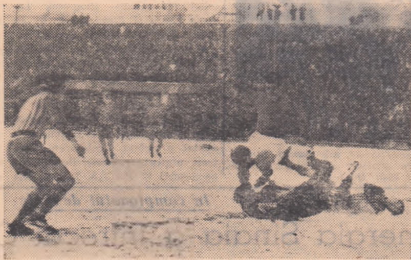
Cînd mingea a fost la Ene, apărarea Progresului nu s-a simțit la largul ei. Fotografia de fază vorbește de la sine...

București: C.C.A. — Locomotiva București, la 15 decembrie.