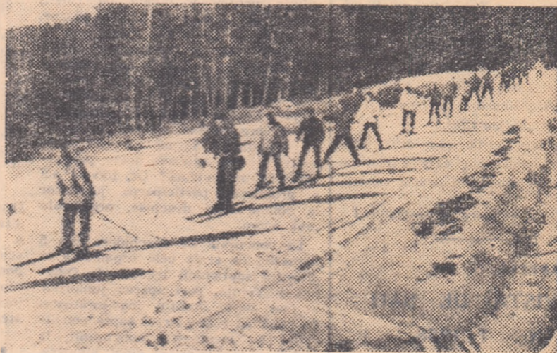
Elevii școlii profesionale „23 August” București coboară — în fir indian — pe una din pîrtiștile pîrtii din apropierea cabanei Cioplea...

Incintătoare surpriză pentru elevi, organizarea unui concurs gen