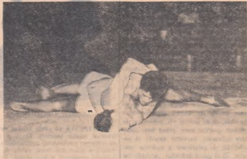
Intrecerile de trîntă din cadrul etapei pe Capitală au dat loc la dispute aprige. Iată, în cîșeu, un aspect de la întrecerile de trîntă care au avut loc în sala Dinamo.