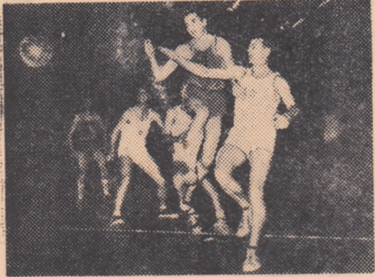
„De ce nu mă lași să trag la coș?” pare să spună figura nemulțumită a lui Borceanu (M.I.G.). În schimb, Folbert (C.C.A.) autorul prompției intervenții urmărește mulțumit traiectoria devială a mingii.