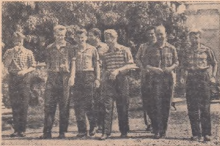
Fotbaliștii sovietici au josit zilele pină la meciul de azi, pentru a vizita capitala țării noastre. În fotografie un grup de jucători dinamoviști într-unul din parcurile Capitalei