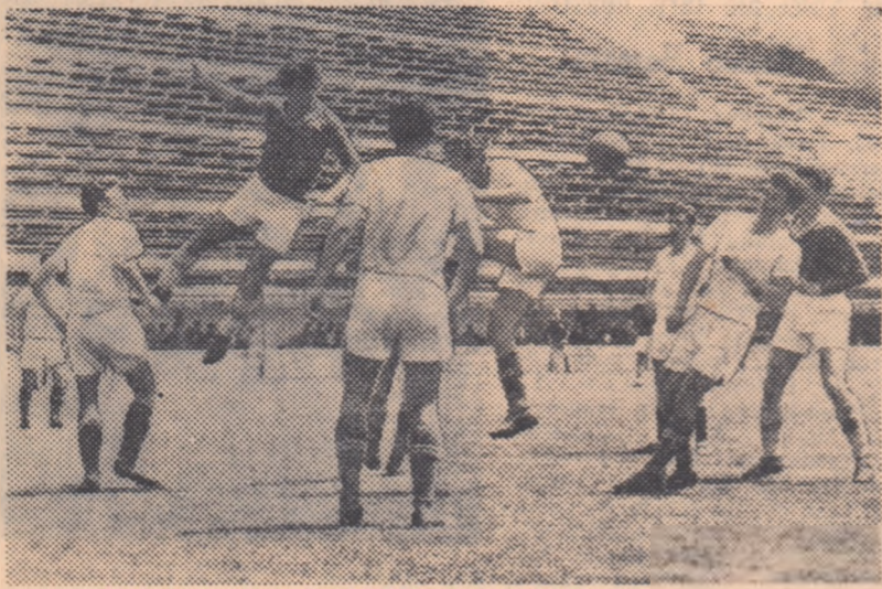
Aglomerat! Pe un spațiu de numai cîțiva metri pătrați, șapte jucători de la Progresul Suceava și doi de la C.F.R. București. De ce? În repriza secundă a meciului C.F.R. București — Progresul Suceava (7-1) ferociar și-au obligat adversarii la o apărare disperată

— Deci sînt condițiuni pentru un progres mai accentuat. Care sînt cau-