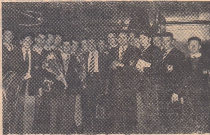
Rugbiștii de la Swansea la câteva momente după sosirea pe aeroportul Băneasa

Conducerea interesantelor partide de astăzi-seară revine arbitrilor internaționali P. Kroner, care va fi ajutat la tușă de V. Dumitrescu și N. Mihăilescu.