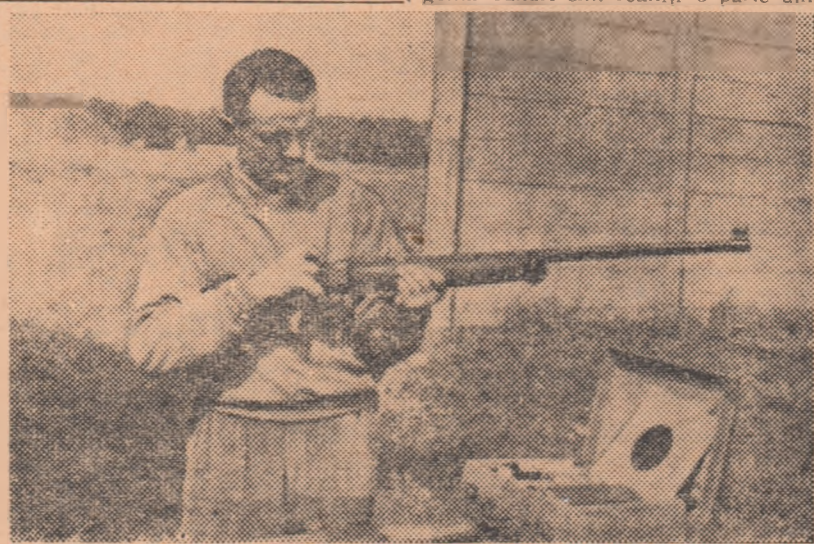
Maestrul emerit al sportului, fostul Sirbu, în timpul pregătirilor pentru Campionatele internaționale.

Și dl. Schäffer consideră sportul ca un factor de seamă în lupta pentru pace: „În Anglia, de pildă, sportul atrage pe toată lumea. După o întrecere sportivă importantă, urmărită de zeci de mii de oameni în tribune și de milioane de alți spectatori la televiziune, se vorbește despre respectivelor evenimente cu un interes extraordinar, în autobuze, în trenuri, pretutindeni. Faptul că doi jucători sovietici, tinerii Potanin și Dimitrieva, participă anul acesta la tradiționalul turneu de la Wimbledon, a stîrnit la noi un mare interes. Iată deci cum se poate crea, prin sport, o atmosferă propice îmbunătățirii relațiilor internaționale. Cred însă că schimburile de sportivi n-ar trebui să se limiteze la echipele naționale sau la sportivi cu nume răsunătoare. Ar trebui să-și facă vizite reciproce și simple echipe sportive de fabrici sau de școli. Tinerii s-ar cunoaște astfel mai bine, s-ar lega prietenii utile cauzei păcii. Vinovăția care încearcă să ne împartă, să intensifice „războiul rece”, ar primi o grea lovitură. Atunci când oamenii se înțeleg, de pildă, pe tîrîmul sportului, este bine pentru pace, pentru prietenia între popoare. Pacea se află și la baza ideii olimpice. Sportul aduce milioane de oameni pe stadioane și stă în puterea noastră, a tuturor, să facem din ei entuziaști luptători pentru pace”.