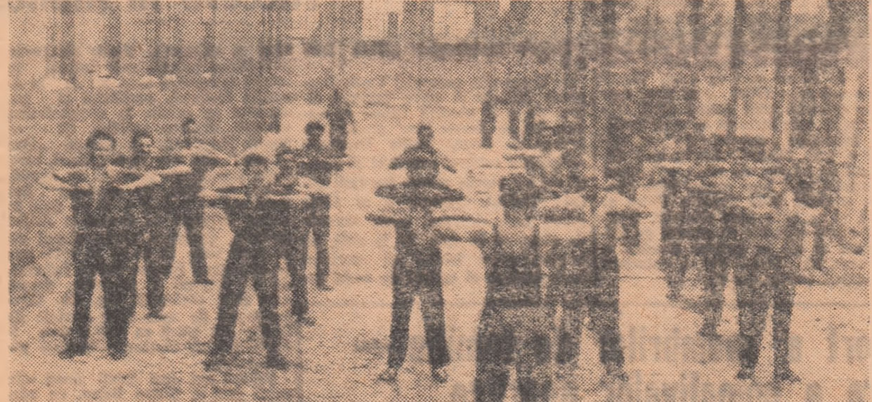
In pauza de la ora 10, muncitorii din secția montaj execută programul zilnic de gimnastică.

viștii din Jimbolia, deoarece au inaugurat-o chiar la 1 iunie — are teren de fotbal, tribună cu 300 locuri, terenuri de volei (și în viitor și de tenis) un minunat strand cu cabine, vestiare, un bufet, în sfîrșit, tot ceea ce-i trebuie unui colectivist la sfîrșit de săptămîna pentru o recreare plăcută. Acum, cei 767 membri înscrîși în U.C.F.S. (față de 140 cîți erau înainte de reorganizarea mișcării sportive) care practică fotbalul, popicele, luptele sau voleiul, vor avea baza lor proprie. Și, poate tot anul acesta, an foarte bogat în realizări pentru sportivii de la G.A.C. „Miciurin”, echipa de fotbal va promova în campionatul regional, aducînd astfel o satisfacție, pe deplin meritată, celor ce le-au creat minunatele condiții de a face sport.