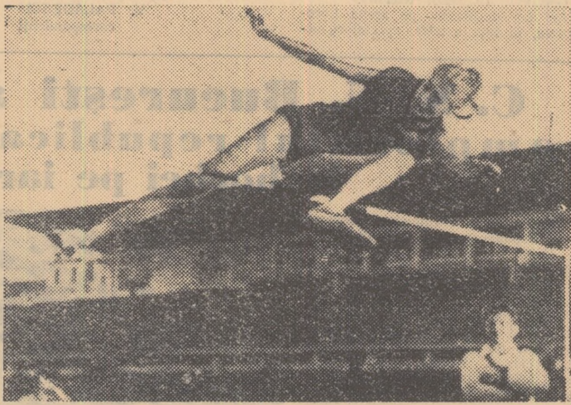
Iată săritura de 1,83 m a Iolande Balas. Nou record mondial!

Au fost de față șefii unor misiuni diplomatice acreditați la București, membri ai Ambasadei R. Cehoslovace în R. P. Română și alți membri ai corpului diplomatic. (Agerpres)