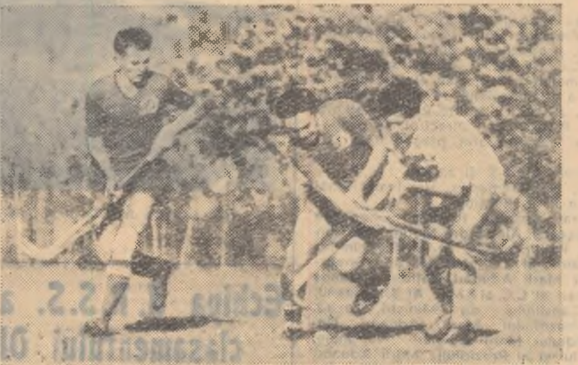
Epure (C.S.U.B.) în luptă pentru balon cu Timar (Dinamo Oradea). Fază din meciul Dinamo Oradea — C.S.U. București 0-0.

performanță de a cuceri titlul de campioană republicană pe anul 1958, după un turneu al cărui clasament final are următoarea înfățișare: