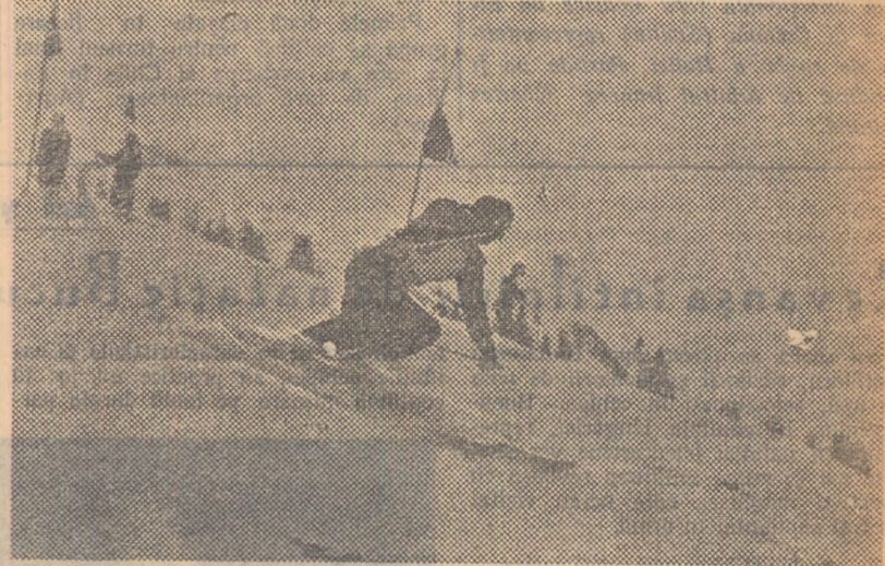
Schișorii sovietici au început sezonul de iarnă. În fotografie: aspect de la un concurs de slalom

În cea mai mare parte a Uniunii Sovietice a poposit iarna. La Zlatouș zapada acoperă în strat gros pământul, termometrul a coborât cu mult în linie sub zero. Duminică trecută s-a desfășurat aici primul concurs oficial de participarea celor mai buni schiori fondiști din Uniunea Sovietică. Băieții s-au întrecut în cursa de 1