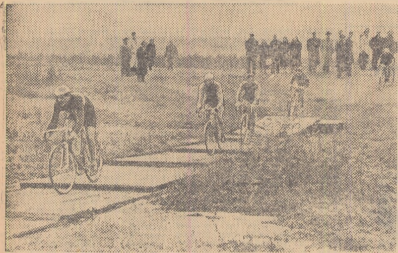
Șt. Poreceanu (C.C.A.) conduce plutonul fruntaș într-una din alergările de ciclocros desfășurate în acest an.

interesant și va permite spectatorilor să urmărească aproape tot parcursul. Cicliștii din lotul republican așteaptă cu nerăbdare confruntarea cu specialiștii ciclocrosului”.