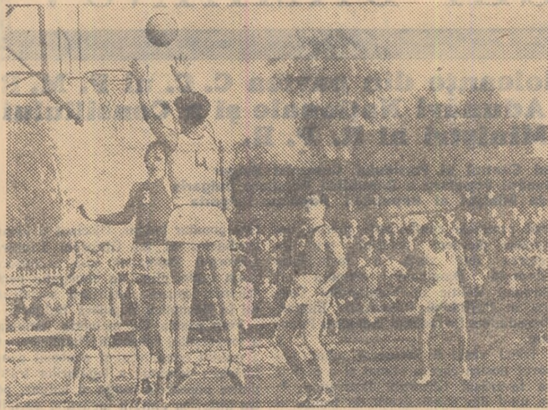
Printre sporturile care cunosc o mare popularitate în R. P. Albania se numără și baschetul. Iată o fază din întâlnirea internațională care a opus formațiile Partizan Tirana și TSKMO Moscova.

Se împlinesc 14 ani de când poporul albanez, scuturând jugul ocupației fasciste și robia feudal-burgheză, și-a cucerit libertatea și independența. Ziua de 29 noiembrie a intrat în istoria Albaniei drept cea mai mare sărbătoare. Ea a însemnat împlinirea năzuințelor de secole spre lumină și libertate, ale micului dar atât de viteazului popor al schipetarilor.