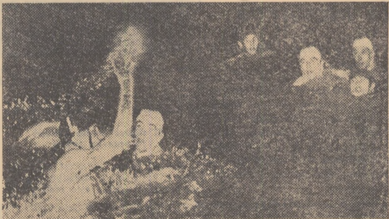
O fază din întîlnirea internațională de polo București-Budapesta, desfășu- rată în Capitala țării noastre.

tactică bazată pe caracteristicile și ca- litățile echipei, să practice un joc în continuă mișcare pe toată durata par- tidei, jucătorii bucareșteni vor putea obține și de astă dată un rezultat fa- vorabil.