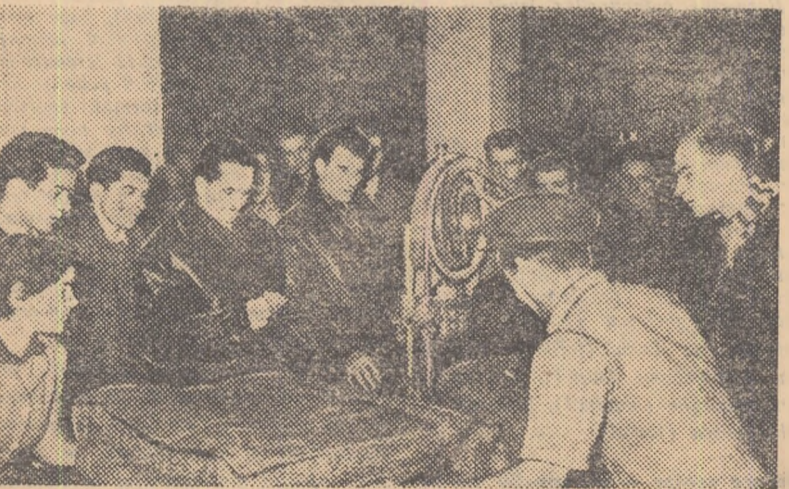
În vizita pe care au făcut-o la Fabrica de confecții „Gh. Gheorghiu-Dej”, componenții selecționatei divizionare de fotbal au manifestat un viu interes pentru procesul de producție. Fotoreporterul nostru i-a surprins pe cînd urmăreau felul cum se decupează cupoanele de stoță cu ajutorul mașinii „Banzing”.