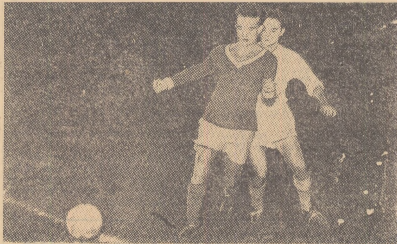
Aspect de la meciul de antrenament susținut joi de selecționata echipelor divizionare din București, în compania echipei C.S.U. București