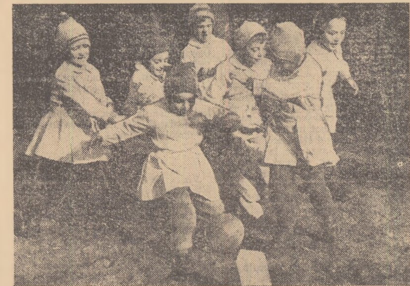
Joc bărbătesc? Firește, dar cu îngăduință... Atacul în trombă al „prichindeilor” fotbalști nu a fost oprit de arbitru. De ce anume? Pleoase să-și bea...