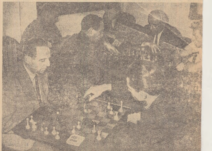
Dirze și pasionante sînt întrecerile de șah din cadrul Spartachiadei de iarnă a tineretului. Ele atrag nu numai tineri și vîrstnici. Oare colectivele sportive din orașul Ploești n-ar putea organiza cît mai multe, asemenea întreceri

Flamura roșie-Dorobanțul, Progresul, ca și din multe alte întreprinderi din oraș. Este timpul să se ia măsuri eficiente pentru ca toate colectivele sportive din Ploești să organizeze neîntîrziat întrecerile etapei pe colectiv.