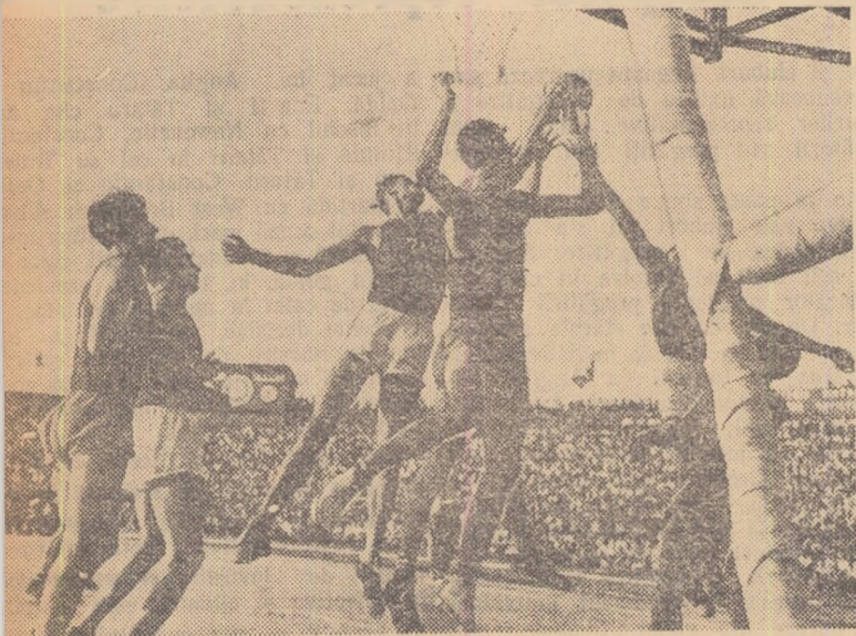
Fază din întâlnirea R.P.R.—U.R.S.S., desfășurată la București în 1957

Reprezentativa masculină de baschet a R. P. Romine susține duminică și luni două întâlniri cu redutabila reprezentativă a Uniunii Sovietice, campioană a Europei. Despre valoarea baschetbaliștilor sovietici vorbesc primul rând excepționalele performanțe înregistrate de-a lungul anilor. Echipa U.R.S.S. a câștigat majoritatea edițiilor campionatelor europene, clasat pe locul secund la olimpiadele din 1952 (Helsinki) și 1956 (Melbourne), iar echipele de club sau naționale de orașe au cucerit primul loc în toate competițiile organizate în ultima vreme (Cupa Campionilor Europeni, Cupa Mairano ș.a.). Reprezentativa masculină a Uniunii Sovietice este alcătuită din jucători de o foarte bună pregătire tehnică și fizică, dotați cu excepționale calități tehnice. Baschetbaliștii sovietici practică un joc superior, în care calitățile tehnice și fizice sunt splendid utilizate pentru realizarea unor combinații tactice eficiente. Echipa Uniunii Sovietice joacă simplu, sobru, iar acțiunile sunt decise și încheiate, în majoritatea cazurilor, cu înscrierea de puncte. Jocul pozițional, cu pivotii alți (Krumins 2,18 m, Mujniks II 2,04 m, Zubkov 2,04 m) este alternat printr-un ritm rapid și cu aruncări decise de la semi-distanță și dintr-un meciul cu reprezentativa țării