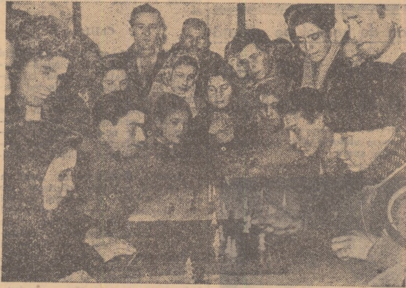
Secție de șah încă nu există dar... amatori sînt destui, după cum se vede și în fotografia noastră făcută cu prilejul întrecerilor din cadrul Spartachiadei de iarnă a tineretului.

La frumoasele rezultate obținute în munca de dezvoltare a activității sportive trebuie adăugate și succesele sportive ale elevilor și pionierilor din comună. De frumoasă apreciere se bucură echipa de gimnastică a școlii și echipa