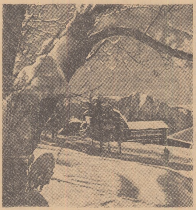
Iarna și-a întins manta ei de hermină peste munți. Lată o imagine care-i cheamă pe turiști să urce spre cabanele acoperite de năframa albă a zăpezii...