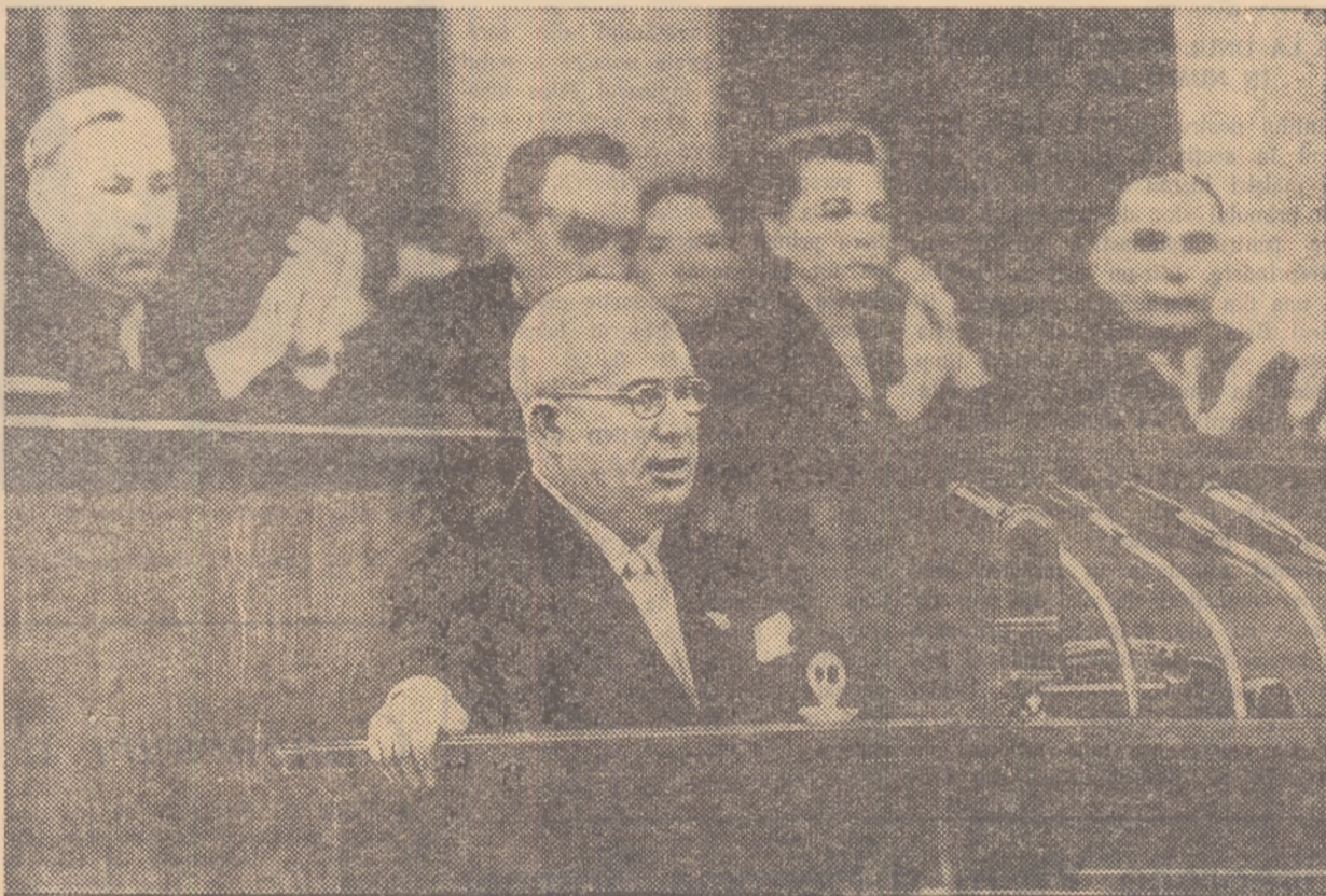
Tovarășul N. S. Hrușciov, prim-secretar al C.C. al P.C.U.S. și președinte al Consiliului de Miniștri al U.R.S.S., prezentînd raportul la Congresul al XXI-lea al P.C.U.S.