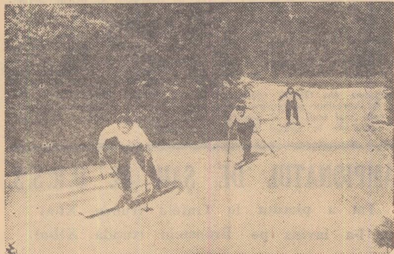
Timpul favorabil practicării schiului trebuie folosit din plin pentru angrenarea a cât mai multor tineri spre practicarea acestui sport. În fotografie, un aspect de la o întrecere de fond din cadrul Spartachiadei tineretului.

o permanentă pregătire, prin care să fie stimulați și încurajați. Tinerii care au participat la Spartachiada de iarnă a tineretului nu trebuie să se limiteze la concursurile de până acum. Asociațiile sportive vor trebui să asigure permanentizarea antrenamentelor și concursurilor tinzând ca fiecare participant la Spartachiada să devină un practicant al schiului și patinajului.