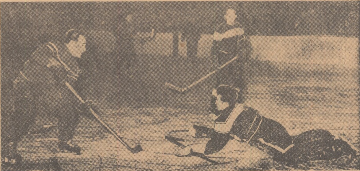
Csaka l trage nestingherit și înscrie peste Scripnicuic, care a plonjat ca un veritabil portar de... fotbal. Faza din meciul C.C.A.—Știința Cluj disputat în prima etapă a campionatului de hochei pe 1959.

Mâine vor avea loc meciurile din cadrul etapei a II-a la ora 10: Dinamo Tg. Mureș—Știința Cluj; ora 16: Recolta M. Ciuc—Progresul Gheorghieni; ora 18: C.C.A.—Voinea M. Ciuc. Intregerile vor lua sfârșit joi, deoarece pentru marți a fost prevăzută o zi liberă.