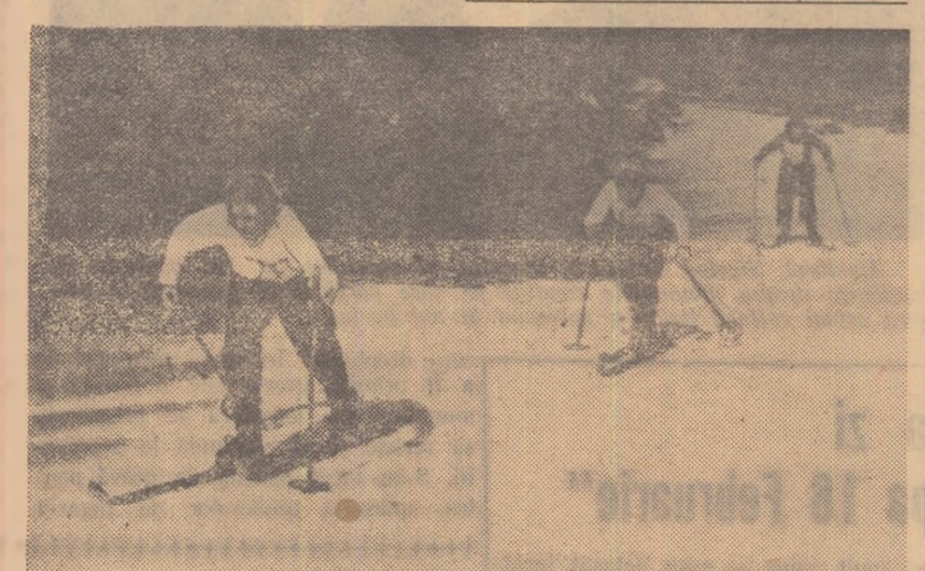
Ca în fiecare an, tineretele din împrejurimile Orașului Stalin se întîlnesc la concursurile sătești organizate în cadrul Spartachiadei de iarnă.

tru a asigura un succes deplin întrecerilor raionale din cadrul Spartachiadei de iarnă a tineretului!