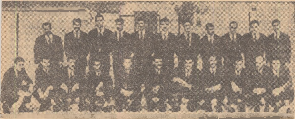
Echipa de fotbal a Algeriei

Asociația dintre fotbal și biliard nu este nouă în vocabularul gazetărilor de sport. Dar joi seara pe „Republicii” ne-a sugerat-o nu numai gazonul terenului, amintind postlăvul verde întins, sau mingea, care în lumina reflectoarelor căpăta luciri de fildeş.