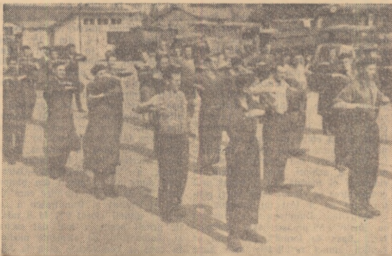
„După cîteva minute de gimnastică în aer liber, munca ni se pare mai ușoară și plăcută” — ne spunea muncitorii de la atelierele nr. 3 și 4, pe care îi vedeți în fotografie executînd cu multă plăcere cîteva exerciții la comanda instructorului lor.

Muncitorii de la atelierul nr. 4 (confecții) și atelierul nr. 3 (mecanică fină) sînt cei mai înflăcărați practicanți ai gimnasticii de producție. O constatare îmbucurătoare: și elementul funin în prezent la exerciții, de fiecare dată, în proporție de 90%.