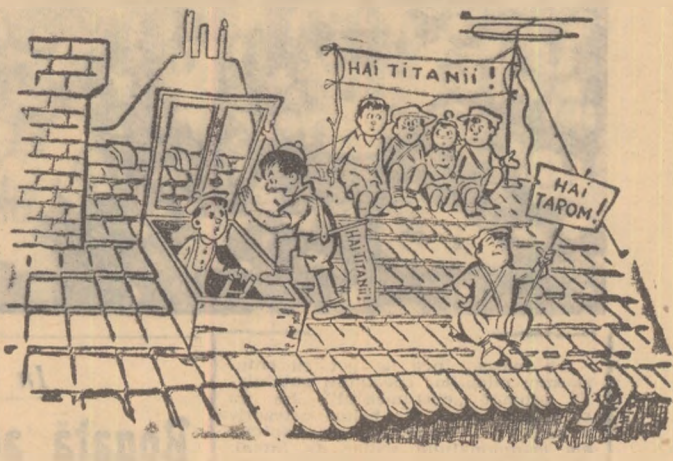
— Cu unul m-am păcălit; tu spune repede cu cine fii? (Desen de D. Petrică)