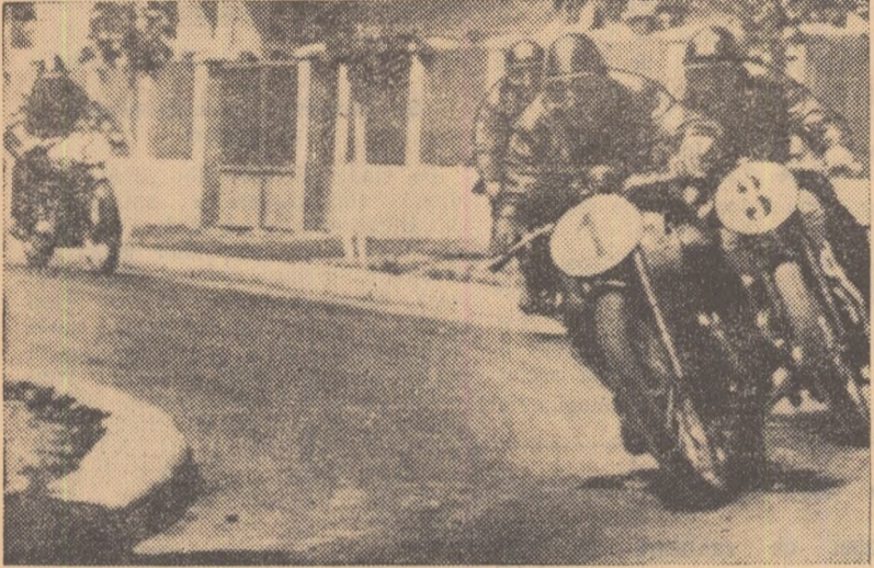
În fața din desfășurarea campionatului republican de viteză pe circuit (ediția 1958) care a avut loc la Cimpina.