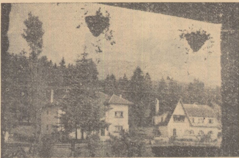
Frumusețea peisajului înconjurător face ca Timișul de Sus să fie una dintre cele mai călulate stațiuni de pe Valea Prahovei. În fotografie, citeva din casele de odihnă de la Timișul de Sus.