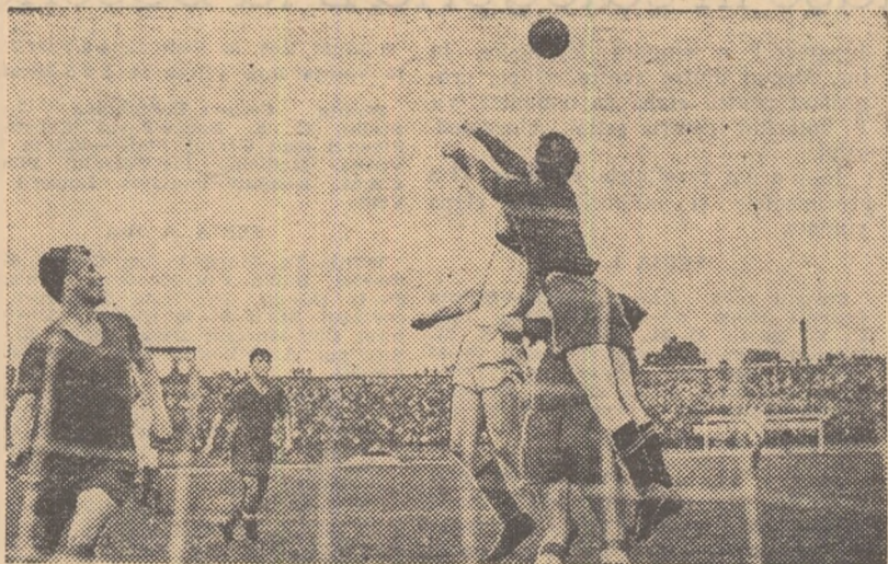
Atac la poarta echipei Dinamo. Ușu respinge balonul cu pumnii peste Moțroc și Dridea. (Juză din jocul Dinamo—Petrolul 2—0)

mult și mai precis la poartă, în concluzie au muncit mai mult și au meritat pe deplin rezultatul.