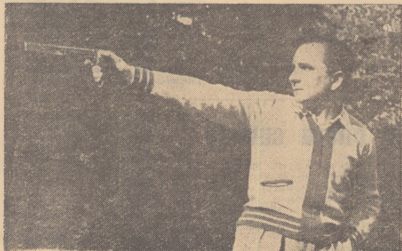
Campionul olimpic Ștefan Petrescu în timpul unui antrenament înaintea campionatelor europene.