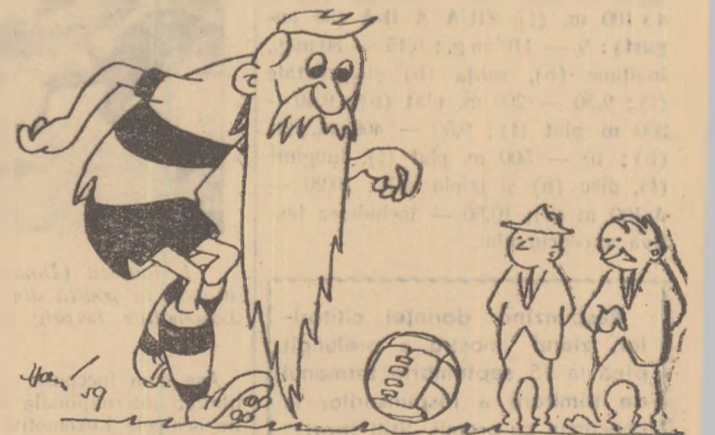
— Trebuie să-l antrenăm portar! Nu mai poate juca extra tremă... Cînd fuge se împiedică-n barbă...