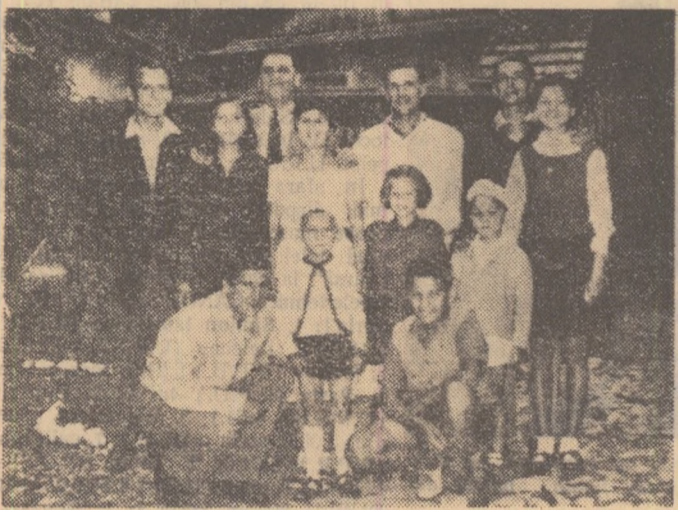
Să nu căutați în această numeroasă familie unul care să nu fie sportiv. Nu-l veți găsi!

Ne aflăm de mai bine de o oră în casa lui Nae Chicomban, cunoscutul polisportiv din orașul de la poalele Tampei. Cine nu-l cunoaște oare? Timp de trei decenii a fost unul dintre cei mai populari sportivi din țara noastră. Ciclist remarcabil, câștigător al atitor întreceri de mare amploare, fotbalist în prima categorie, schior și atlet, Nae Chicomban, actualul antrenor al Școlii sportive U.C.F.S. din orașul Stalin, a iubit încă din fragedă copilărie sportul.