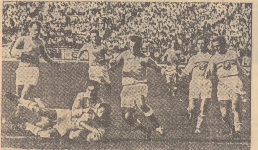
Iată-l pe Penciu în momentul în care „culcă” prima încercare a echipei noastre. Sîntem în minutul 12 și scorul este acum: 3-0!

Iată cum s-a marcat. În min. 12 Penciu înscrie o încercare pe care el o transformă: 5-0; min. 19 Penciu