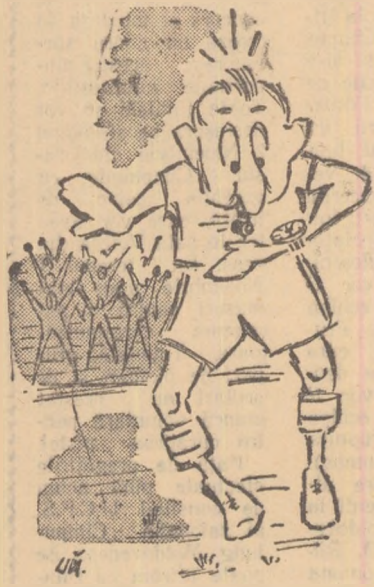
Desen de D. Mihăilă

Păcat că nu s-a întâmplat să aveți ocazia să fiți martori la o partidă de fotbal cu totul deosebită de cele pe care le-ați urmărit până acum, chit că au fost de categoria A sau chiar internaționale: o întâlnire cu trei... începuturi și tot atâtea... sfârșituri!