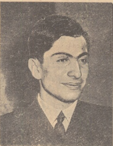
MIHAIL TAL (U.R.S.S.)

În clasament: Tal 12, Keres 10½, Petrosian, Gligoric 8½ (1), Smislov 8, Fisher 6½ (2), Benkő 6(1), Olafsson 5 (1).