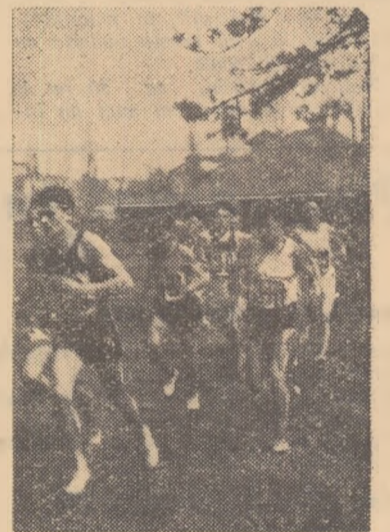
Aspect din desfășurarea unei întreceri de cros

• LA SATU MARE primele concursuri s-au desfășurat în ziua de 21 septembrie. Asociațiile sportive din